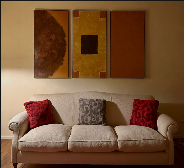
Studio professionale — Firenze, Italia Professional studio — Florence, Italy