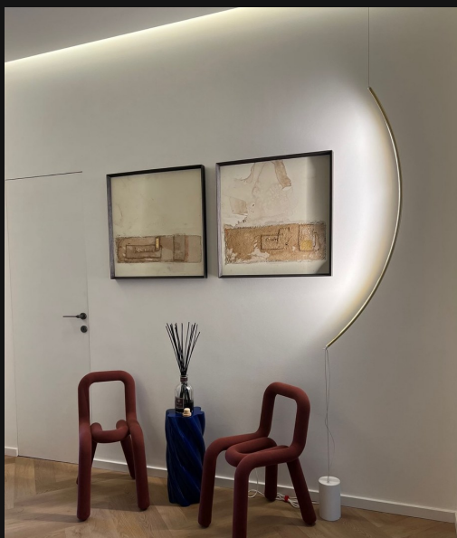
Appartamento contemporaneo — Italia Contemporary apartment — Italy