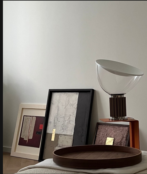
Villa privata — Toscana, Italia Private villa — Tuscany, Italy