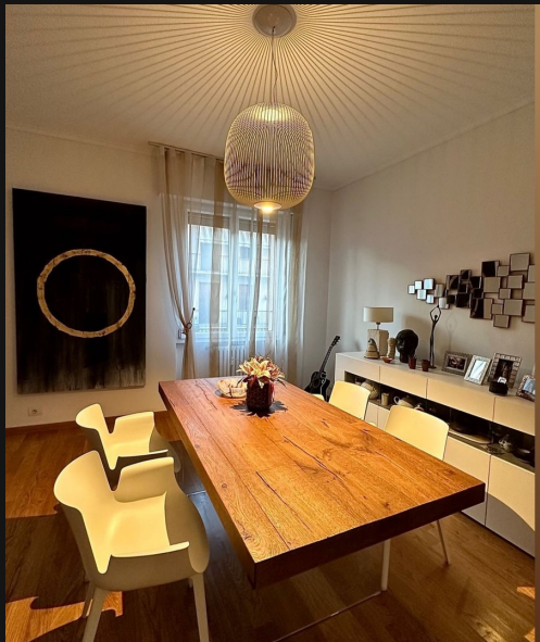
Residenza privata — Italia Private residence — Italy