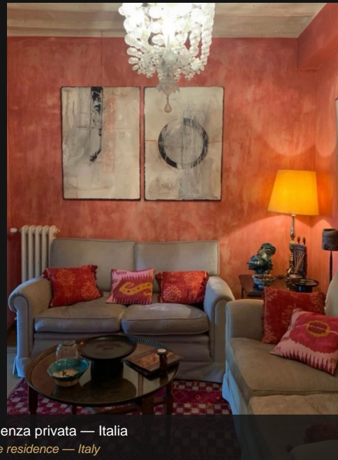
Residenza privata — Italia Private residence — Italy